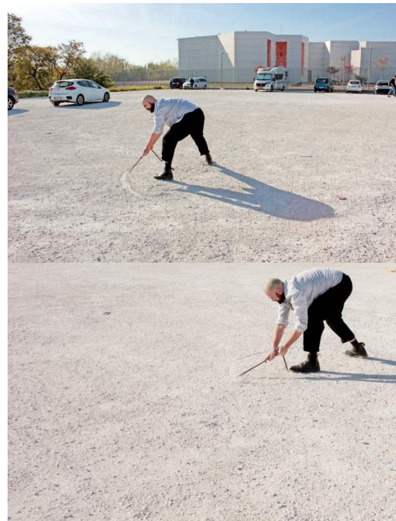
Ictus, 2023. Performance, escarbado sobre parking, Córdoba.

Ictus nació de un reencuentro con lo pequeño, repensado cómo un ejercicio simbólico también puede atravesar. Desde pequeño me atraían muchos aquellos usuarios de parkings y descampados, aquellos que pasamos los días esperando a Godot. Esperando que llegue alguna cose para remediar este presente sin freno, decidimos quedarnos en el moribundo parking, descubriendo cómo estos lugares pueden ser territorios mágicos que contienen lo físico, histórico y simbólico a torcer. De allí nace el asilvestrar la escala de mis trabajos site specific.